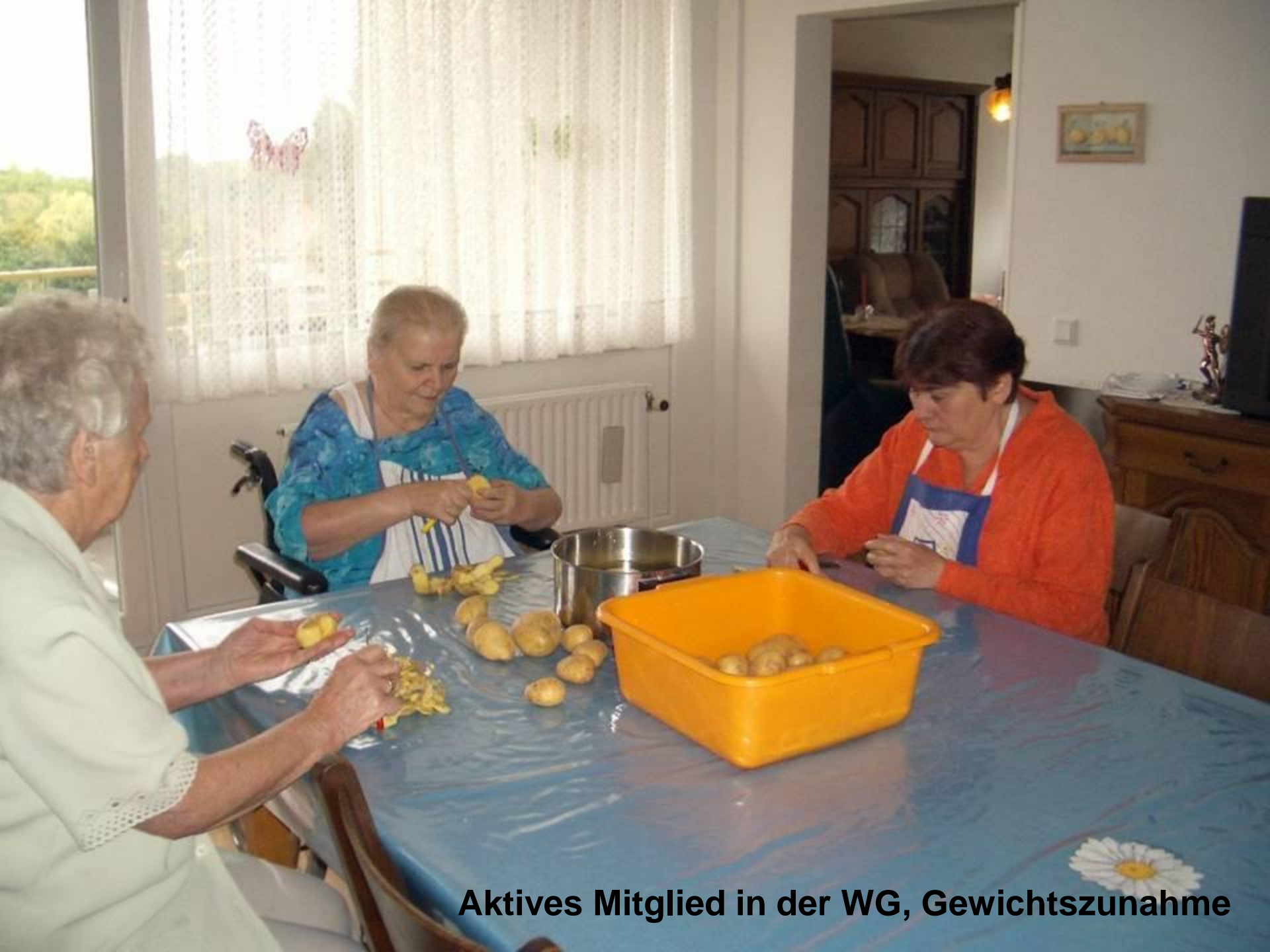
Aktives Mitglied in der WG, Gewichtszunahme