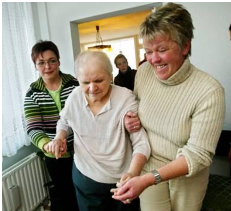
Erster Gang ins Wohnzimmer